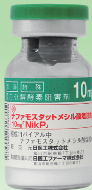
ナファモスタットメシル酸塩 注射用10mg「NikP」