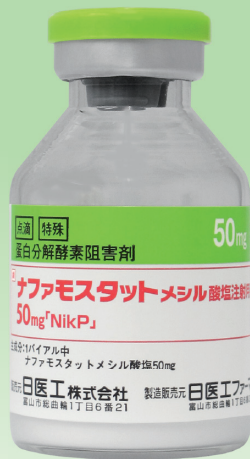
ナファモスタットメシル酸塩 注射用50mg「NikP」