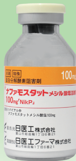
ナファモスタットメシル酸塩 注射用100mg「NikP」